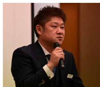
伴会長より今年度の振り返りと感謝の言葉が述べられました