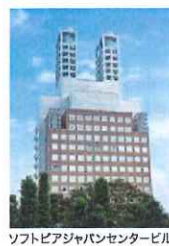
ソフトピアジャパンセンタービル