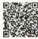
▲職場における妊娠中の女性労働者等への配慮について（厚生労働省HP）

母健連絡カード（母性健康管理指導事項連絡カード）は、厚生労働省ホームページや「女性にやさしい職場づくりナビ」からダウンロードできます。また、ほとんどの母子健康手帳にも様式が記載されています。