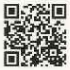
▲女性にやさしい職場づくりナビ