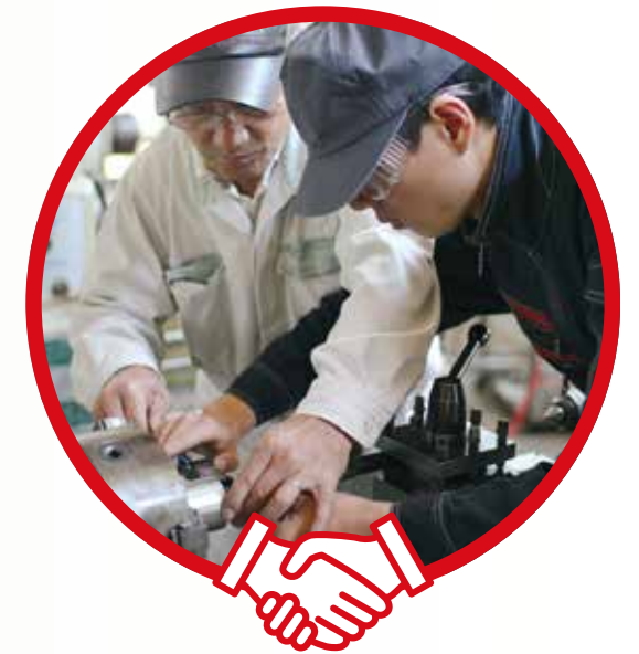
●三井造船(株) 玉野事業所内の技能研修センターにて

造船業を基幹産業とする市において、地元企業の即戦力として活躍できる優秀な人材を育成する事業に対し、市内で創業し、現在も事業所を置く三井造船(株)が、市長のトップセールスを受け、6,500万円の寄附を行う予定。