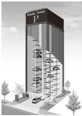
【重列式パズルタワー】 （エレベーター方式くし歯式）