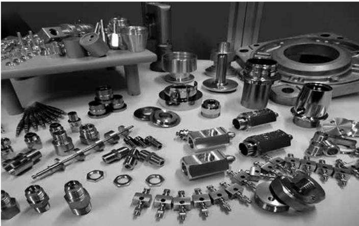
▲ 同社で加工した高精度高品質を求められる製品群