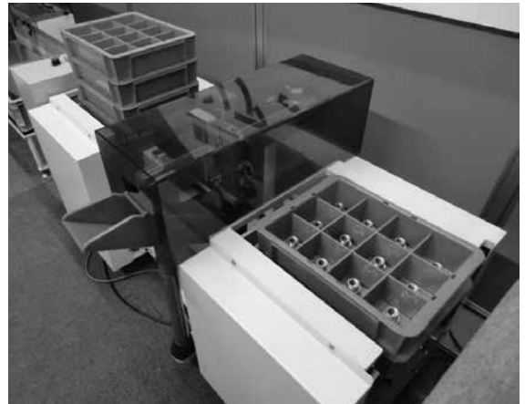
▲ 長時間無人稼働に対応する 自社製品ダコンアンシン

で、自社製品の納入先からトラブルの相談があっても電話口ですぐに処置方法を説明し、即解決できることもあります。同様な設備メーカーはあっても、加工現場をもっている会社はほとんどありません。二つの事業がまさに会社の両輪で、両事業を共に成長させていくことで当社の企業価値が高まっていくと考えています。