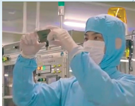
製品のできばえを確認する エンジニア