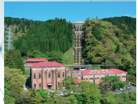
100年以上発電を続ける 水力発電所(東横山発電所)