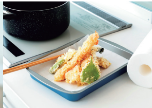
クッキングペーパー